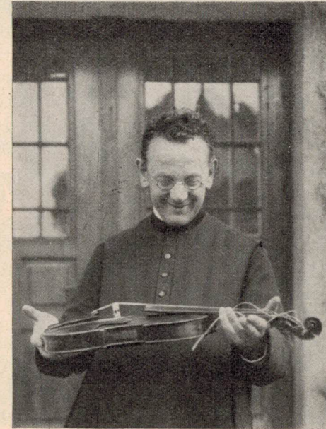
Der Jubilar einst

Nicht weniger freudig sang der Chor das an zweiter Stelle gewünschte Lied seiner Marienminne: „Ich weiß ein Wort voll Melodie, das einst der Welt erklangen.“